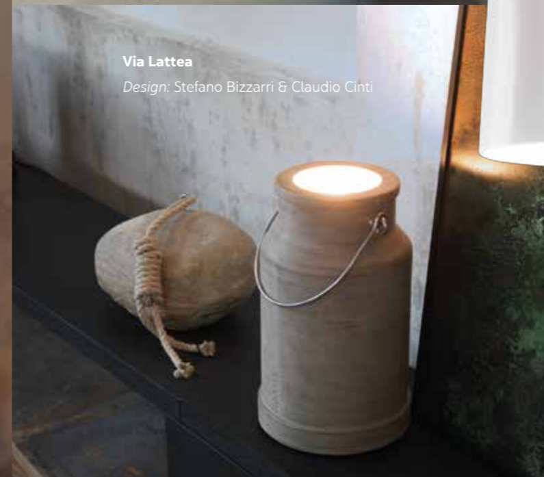
Via Lattea Design: Stefano Bizzarri & Claudio Cinti