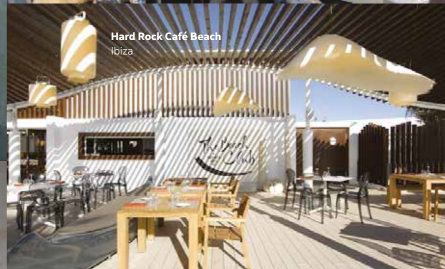
Hard Rock Café Beach Ibiza