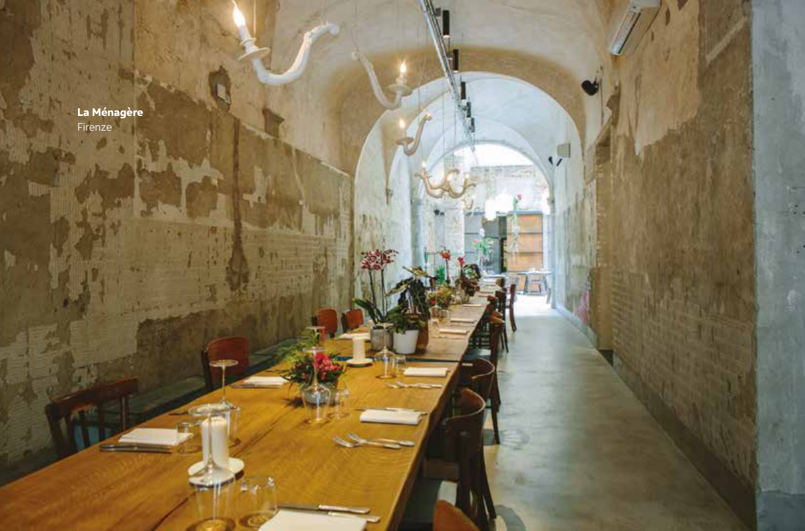
La Ménagère Firenze