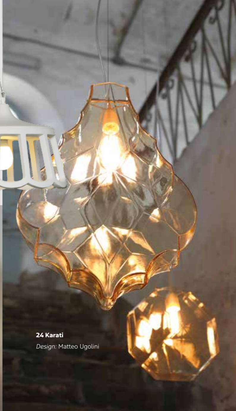
24 Karati Design: Matteo Ugolini