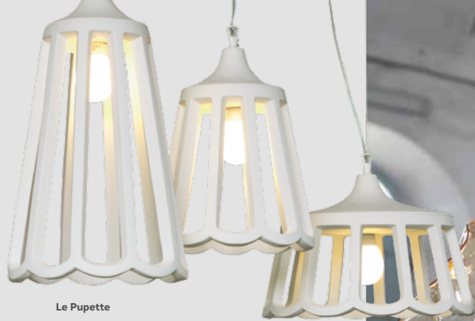
Le Pupette Design: Edmondo Testaguzza