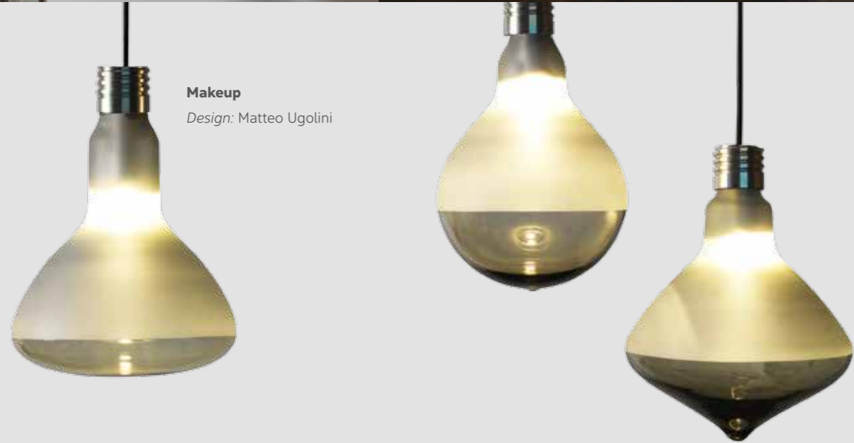
Makeup Design: Matteo Ugolini