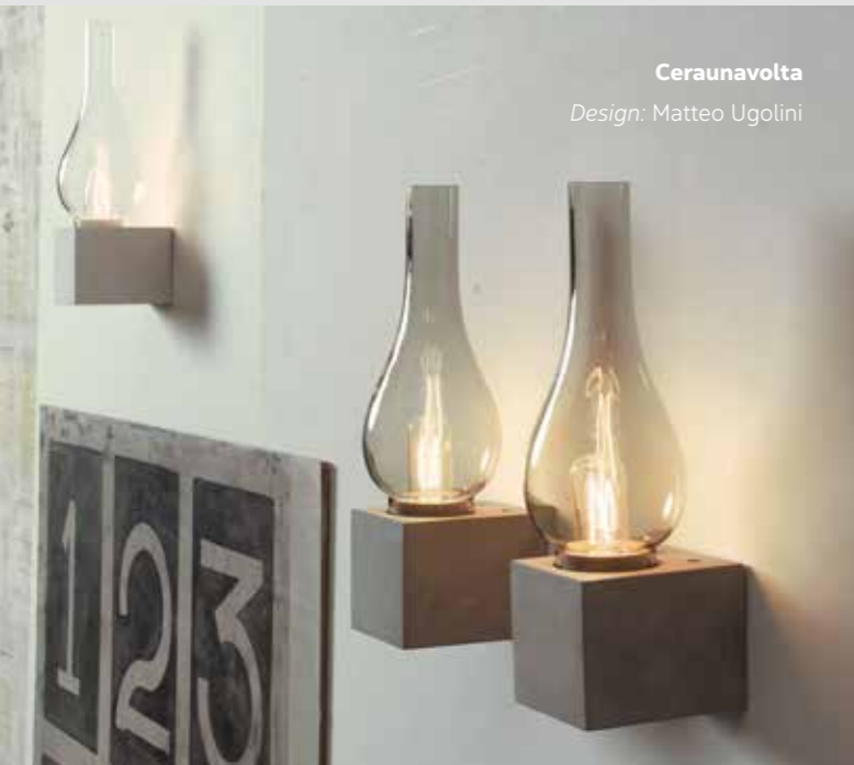
Ceraunavolta Design: Matteo Ugolini