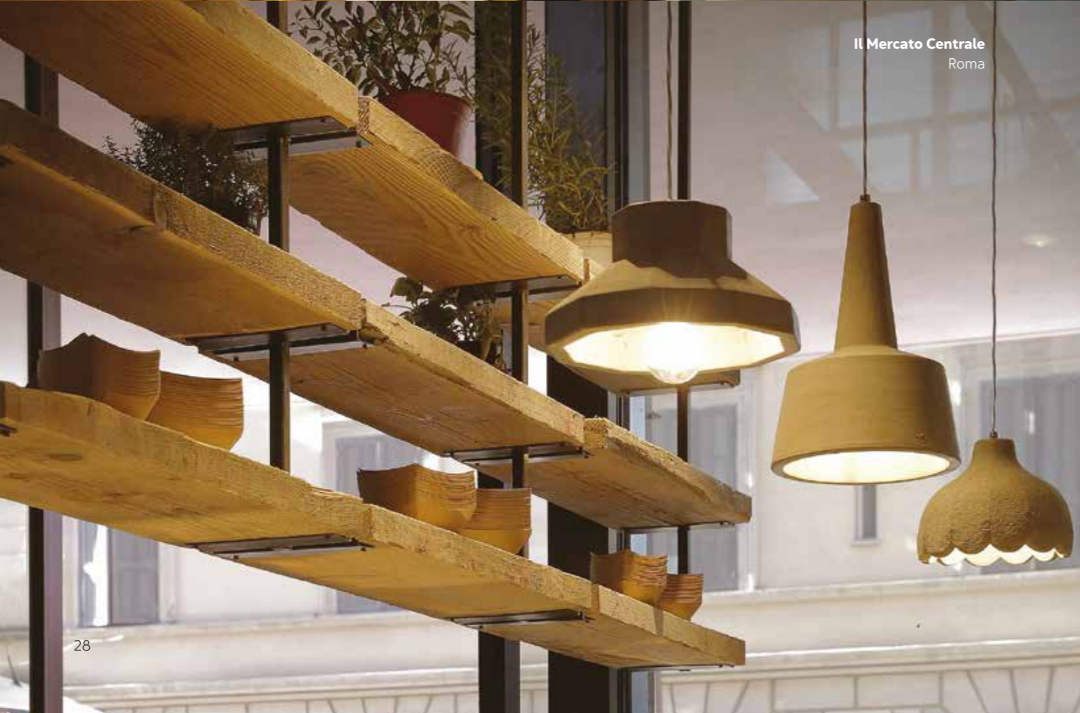
Il Mercato Centrale Roma