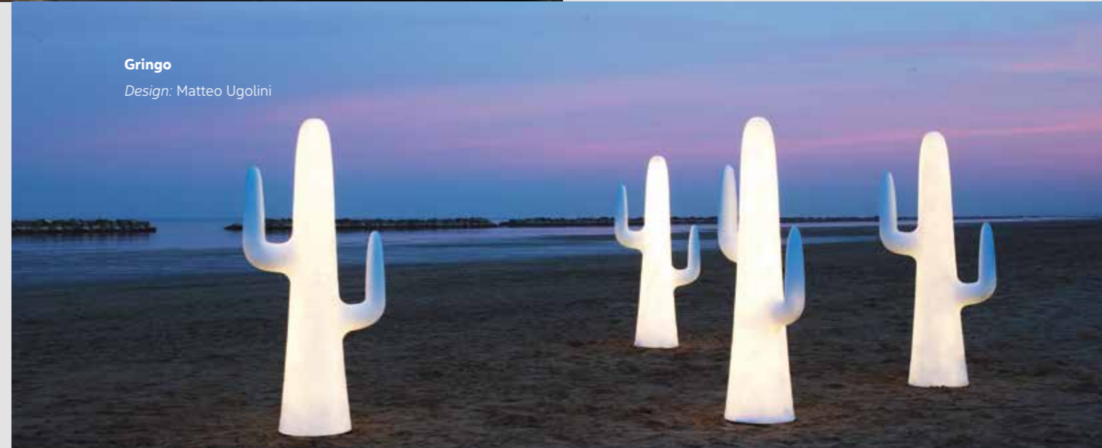
Gringo Design: Matteo Ugolini