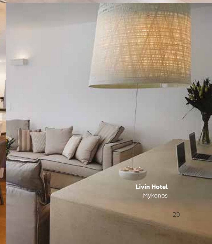
Livin Hotel Mykonos