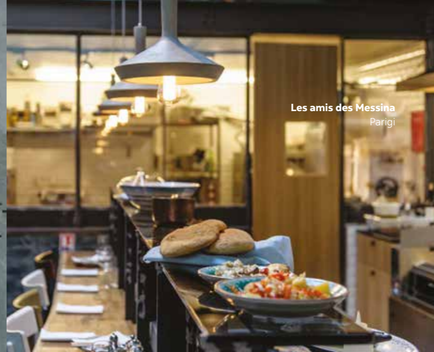
Les amis des Messina Parigi