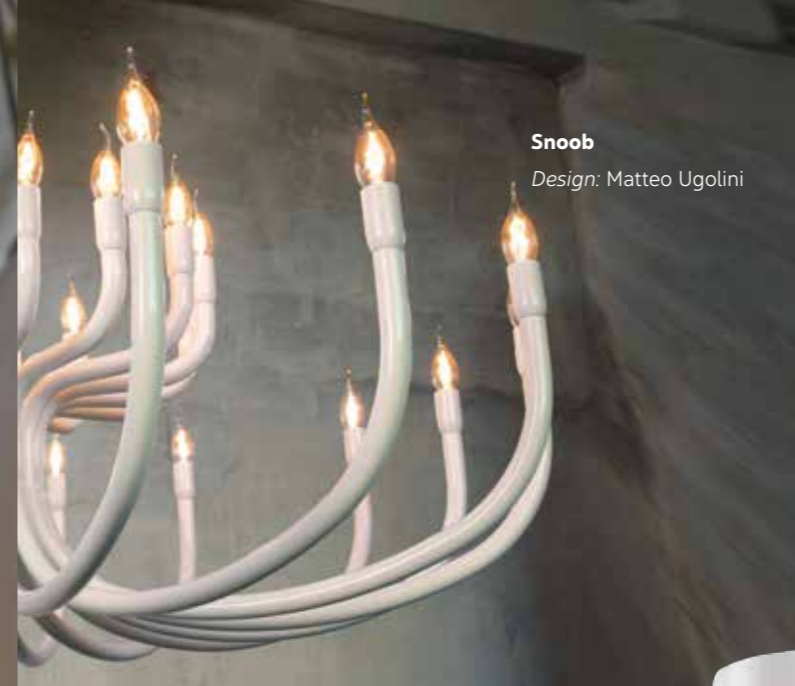
Snoob Design: Matteo Ugolini