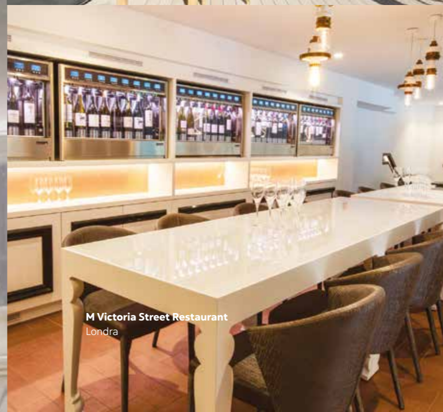
M Victoria Street Restaurant Londra